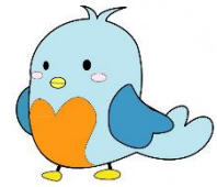
マスコットキャラクター ハッピー

なにか相談事があるときには、係に直接、または担任を通して、いつでも気軽にご相談ください。